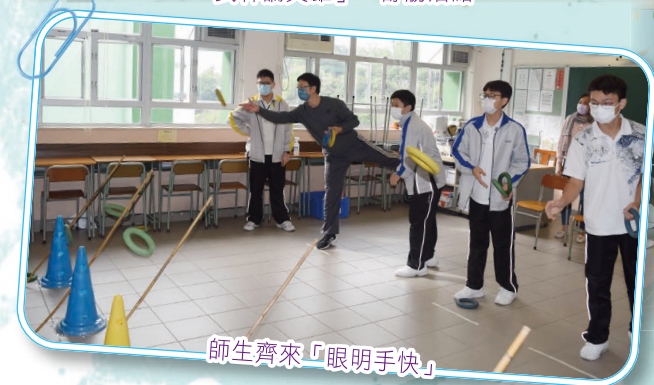
師生齊來「眼明手快」