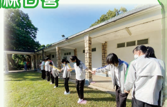
無懼痛楚，齊心走過卵石路

訓練日營讓我印象最深刻的是「搵阿婆」這活動。通過一連串任務，阿婆「離家出走」的謎團逐步解開。從遊戲的每個部分到最後的分享感想環節，我學會了聆聽、合作、有商有量……這是個促進我成長的好活動！