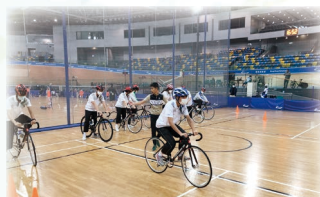
一嘗成為場地單車手的滋味

這活動令我明白職業場地單車選手訓練過程的艱辛，亦令我瞭解場地單車看起來組裝簡易，但由於它較平常的單車少了煞車系統、響鈴等，要習慣還是比較困難。此外，單車館的貴賓室亦令我大開眼界，室內寬廣的玻璃窗能把館內全景盡收眼底，單車比賽的一幕幕精彩時刻都能一覽無遺。