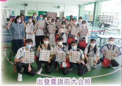
出發賣旗前大合照

這是疫情肆虐以來，我第一次參加義工活動。在賣旗過程中，遇到不少善心人士捐款支持，更有街坊對我說「加油啊！」等鼓勵的話語，令不善與人打交道的我深受鼓舞，逐漸打開心扉。而且，一想到能幫助有需要的長者，馬上士氣如虹，努力賣旗！