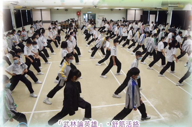
「武林論英雄」，舒筋活絡

按下計時器，七人一組的「你撐我，我撐你」隨即開始，既有同學又有老師參加，他們都努力堅持著，當有同學快將放棄時，在旁的同學便會為他打氣，氣氛絕不遜於以往的陸運會，極大多數同學都能完成支撐一分鐘的目標！一個個同學和老師從我手中接過蓋好印章的記錄紙，他們都表現得心花怒放，我也樂在其中！