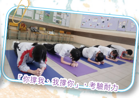
「你撐我、我撐你」，考驗耐力