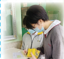
透過訪問加深對學弟學妹的瞭解

參加計劃，我很希望藉着這個機會認識不同的人 and 事，亦期望藉此挑戰自己。透過訪問，我不但達成所望，還學會如何做好一個帶領的角色。我很期待之後導航計劃的其他活動。