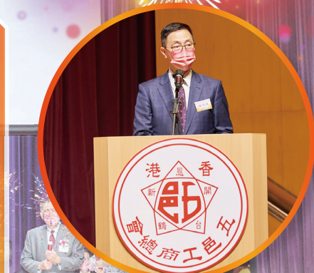
教育局局長楊潤雄JP蒞臨主禮，予以祝賀

百年，從前覺得它只能給人帶來冗長、守舊的感覺，但在總會一直默默耕耘的路上，我卻看到了它活力充沛、年輕有為的一面——久經風雨後所擁有的無畏前行之勇氣及無限的創造力。