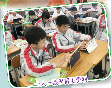
一人一機學習更便利