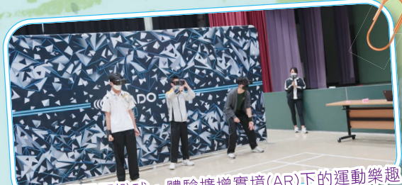
齊來玩電子閃避球，體驗擴增實境(AR)下的運動樂趣

在陽光明媚的一天，我們參加了學校舉辦的運動體驗日。校長致詞和升旗禮後，我們按老師的安排到二樓參加各項活動。即使我毫無體育細胞，但也充滿了幹勁！我和同學跟著遊戲卡上的順序逐一體驗不同的活動，每一個活動都非常有趣，在場還有學兄學姊照顧著我們，也有老師和我一起「作戰」，十分熱鬧呢！雖然疫情下不能到大型運動場參加活動，但在學校能和老師及同學一起活動，也非常高興呢！