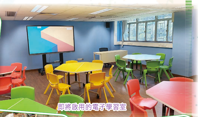
即將啟用的電子學習室