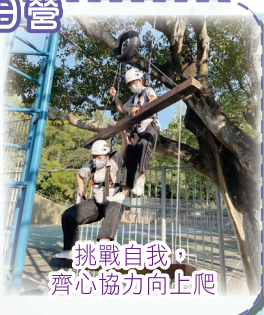
挑戰自我，齊心協力向上爬

參加了這個日營，我獲益良多，明白到團隊合作的重要。活動過程中，有不少任務都需要和同學合作才能完成。記得有一個環節是要爬上一座巨人梯，再敲響銅鐘才算完成，這個任務非靠團隊合作沒法完成，而且它還能提升我們的解難和處事能力。