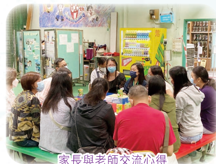
家長與老師交流心得