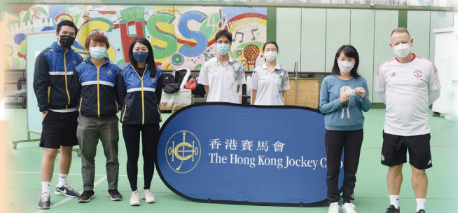
曼聯足球學校教練來校主持運動體驗日的足球活動