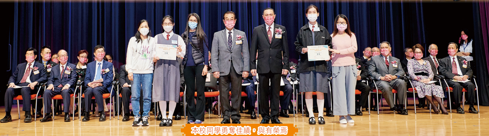
本校同學勇奪佳績，與有榮焉