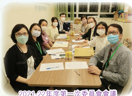
2021-22年度第一次委員會會議