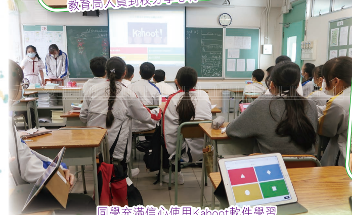
同學充滿信心使用Kahoot軟件學習