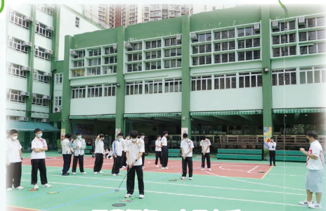
同學揮杆，大展身手

我很高興能透過是次活動接觸高爾夫球。從前看着球手輕盈地把球杆一揮，球便準確入洞，動作行云流水，讓我誤以為它很簡單。當自己實際操作時，卻發現原來每個姿勢、力度和動作也十分講究，稍有偏差球便會偏離軌道，別具挑戰。