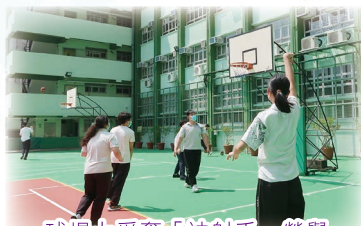
球場上爭奪「神射手」榮譽

作為「三分神射手」活動中為數不多的女參賽者，我十分緊張。第一輪比賽中，對手是一名男子籃球隊的隊員，這讓我瞬間產生了壓力。經過一番激烈的對決，最後我還是被他一記「穿針」擊敗了。雖然我最後未能晉級，但這次的經歷讓我發現自己的不足。雖然三分球不是我的強項，但「鍥而不舍，金石可鏤」，我相信藉著百折不撓的精神和不斷的練習，終有一天我能戰勝強敵。