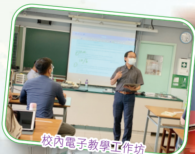
校內電子教學工作坊