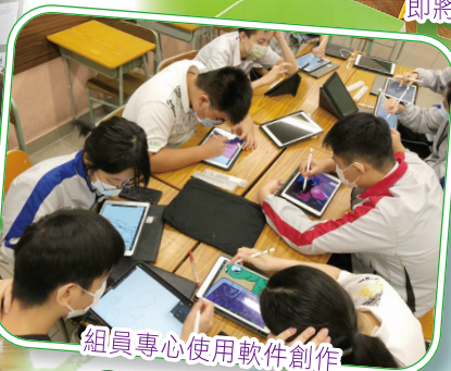
組員專心使用軟件創作