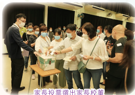
家長投票選出家長校董