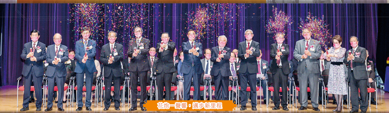
花炮一聲響，邁步新里程