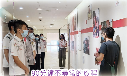
90分鐘不尋常的旅程令同學對戰爭有更深刻的體會

這活動令我體會到生活在戰亂中的可怕。當地人每天都過得膽戰心驚，天天看着家附近的建築被炮彈摧毀，附近的居民越來越少，真是令人髮指！他們無時無刻都擔心炮彈會否突然落在他們身上，想逃，卻又無處可逃，生命懸於一線。這令我深切感受到自己能出生於沒有戰爭的和平國度，實在十分幸福。