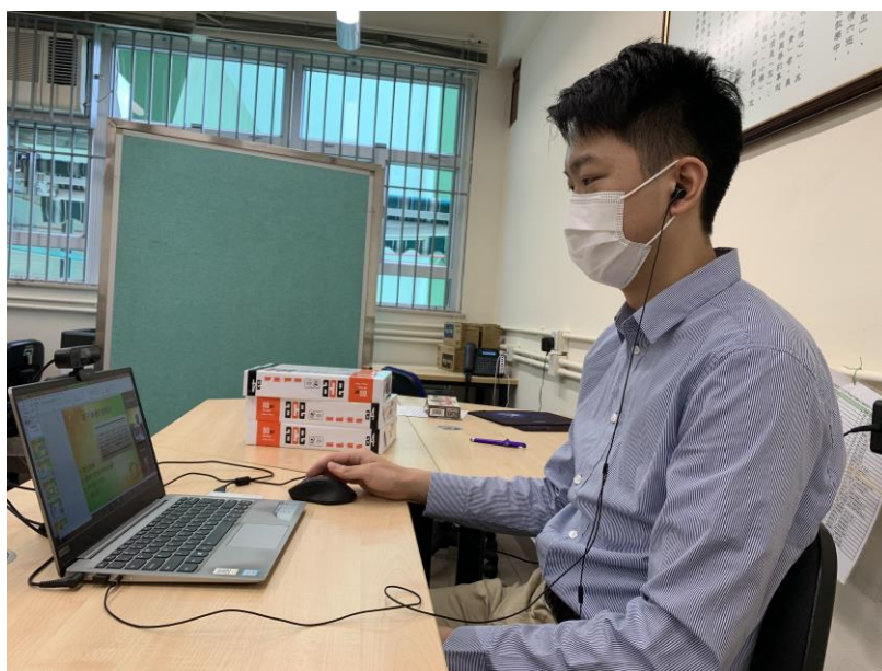
老師正主持網上講座