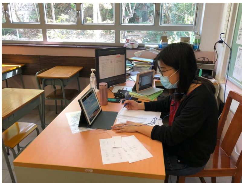
老師正主持網上講座