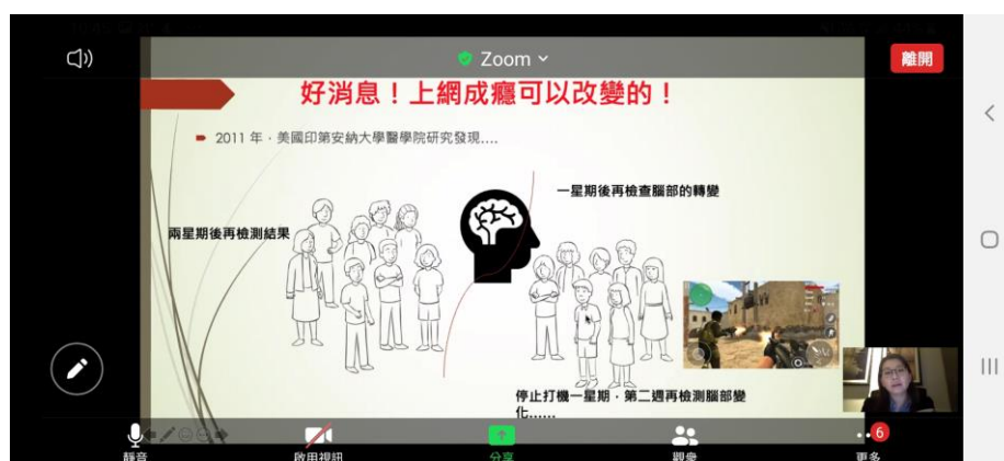
蔡醫生對青少年網上成癮有深入的研究