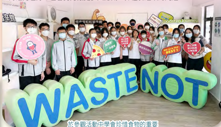
於參觀活動中學會珍惜食物的重要

經過這次的學習，我受益匪淺，我會盡自己的一分力，哪怕是微薄之力也好，也會努力讓更多人認識世界糧食短缺的問題。