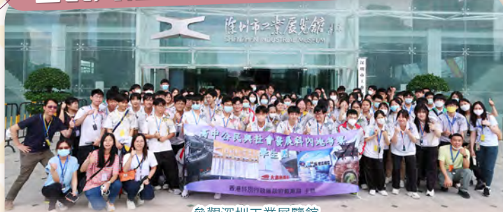
參觀深圳工業展覽館