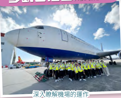
深入瞭解機場的運作