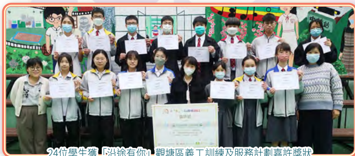
24位學生獲「沿途有你」觀塘區義工訓練及服務計劃嘉許獎狀