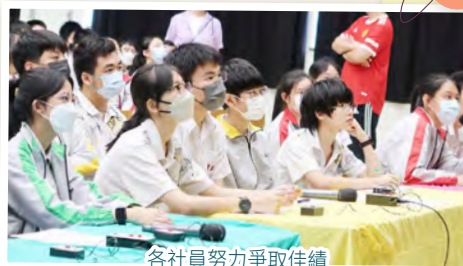
各社員努力爭取佳績