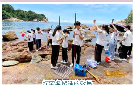
探究各螺種的數量

這次旅程讓我體會到原來「學習」也可以是如此生動的詞語。在旅程中，我們先認識不同的岩岸生物，以及學習量度生物因子及非生物因子；然後出發到海灘進行實戰。各種螺兒外形相似，初時難以分辨，但閱讀《岩岸野外辨認冊》後便漸漸找出辨認的規律！實戰過程比我想像中艱辛，不但要頂着大太陽尋找目標螺種，還要全程拿著2米長的尺子量度範圍內目標螺種的數量。但這高難度的挑戰為我們帶來成功感，亦令我不禁敬佩長久以來為我們提供準確數據的專業人員。