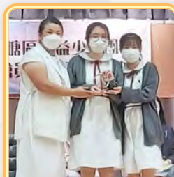
公益少年團獲「環保為公益」慈善花卉義賣優異獎