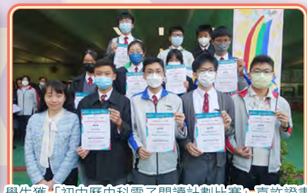
學生獲「初中歷史科電子閱讀計劃比賽」嘉許證書