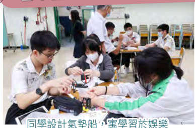
同學設計氣墊船，寓學習於娛樂