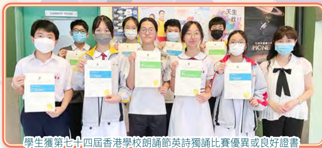
學生獲第七十四屆香港學校朗誦節英詩獨誦比賽優異或良好證書