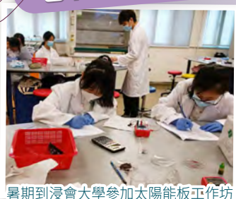
暑期到浸會大學參加太陽能板工作坊