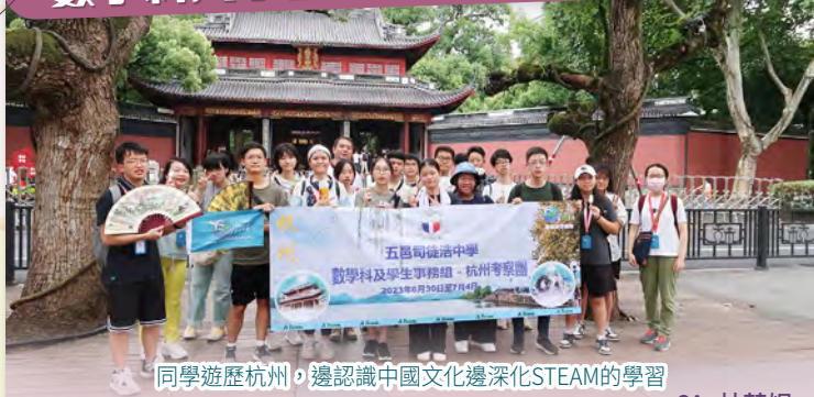
同學遊歷杭州，邊認識中國文化邊深化STEAM的學習