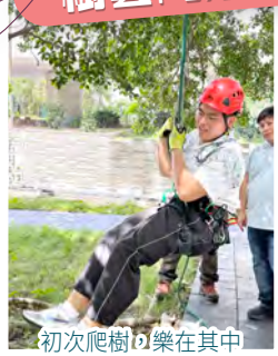
初次爬樹以樂在其中