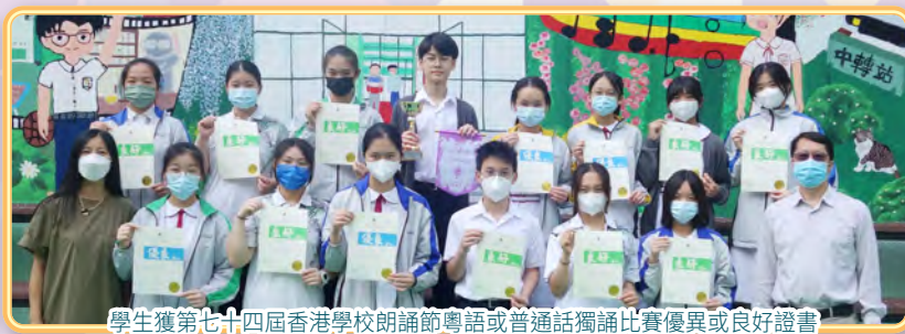
學生獲第七十四屆香港學校朗誦節粵語或普通話獨誦比賽優異或良好證書