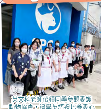
英文科老師帶領同學參觀愛護動物協會，邊學英語邊培養愛心