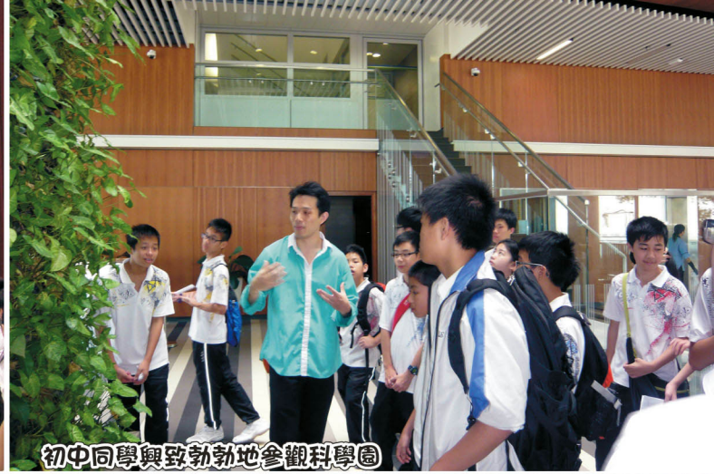
初中同學興致勃勃地參觀科學園