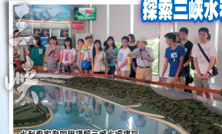
水利專家為同學講解三峽水壩建設