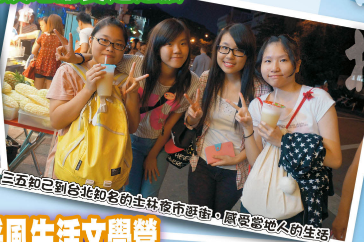
三五知己到台北知名的士林夜市逛街，感受當地人的生活