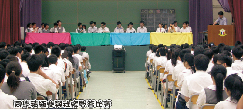
同學積極參與社際問答比賽