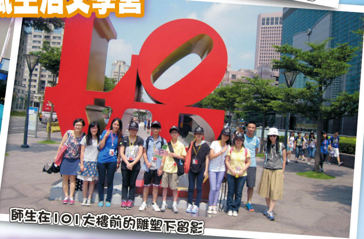
師生在101大樓前的雕塑下留影