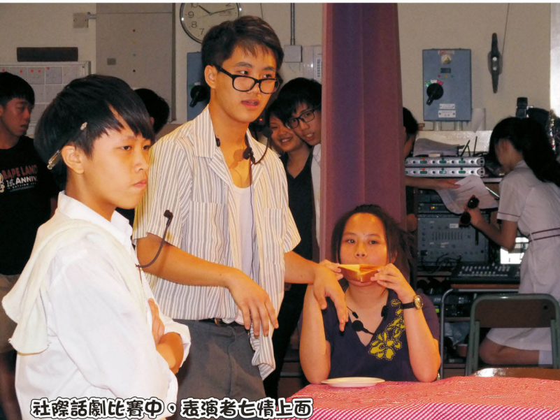
社際話劇比賽中，表演者七情上面