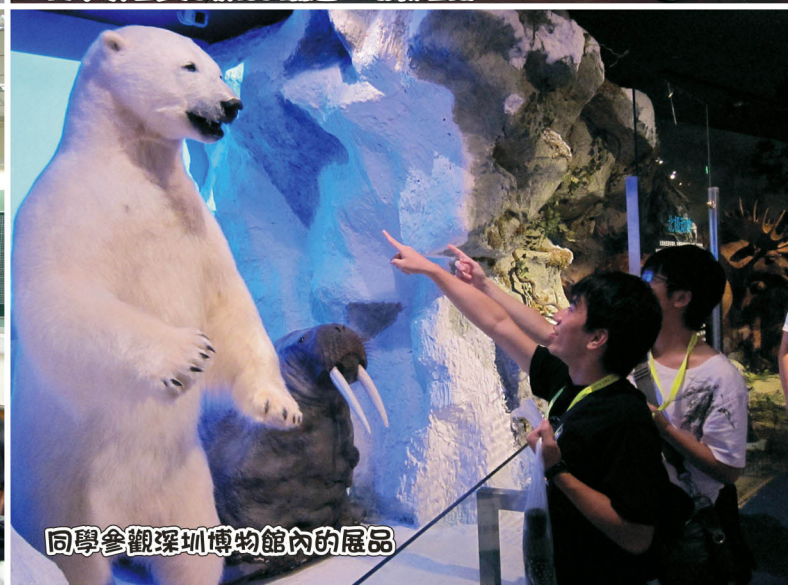
同學參觀深圳博物館內的展品