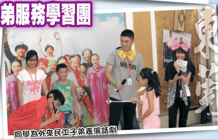
同學為外來民工子弟表演話劇