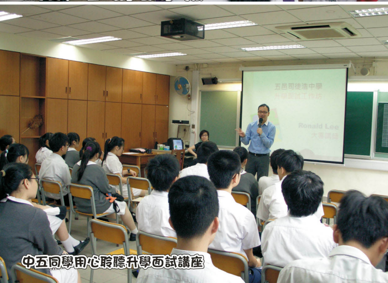
中五同學用心聆聽升學面試講座