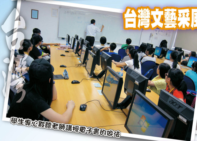
學生專心聆聽老師講授電子書的做法