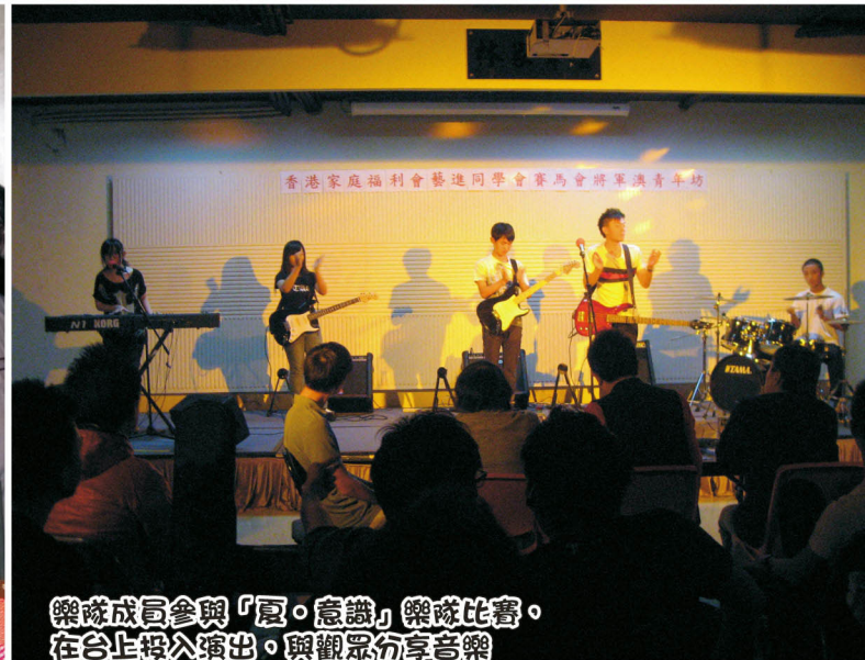
樂隊成員參與「夏·意識」樂隊比賽，在台上投入演出，與觀眾分享音樂