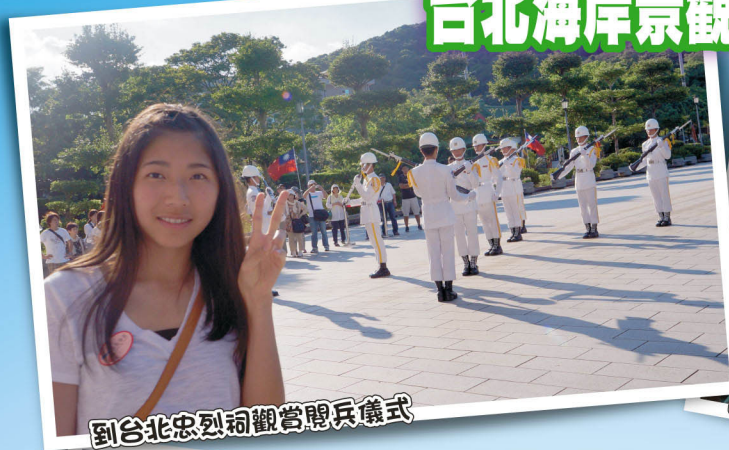
到台北忠烈祠觀看閱兵儀式