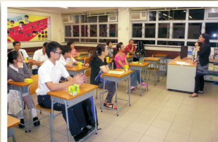
班主任進一步回應家長的提問