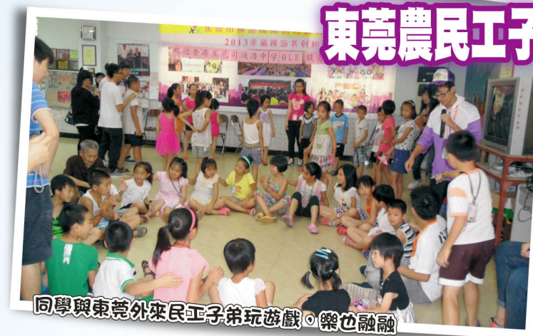
同學與東莞外來民工子弟玩遊戲，樂也融融