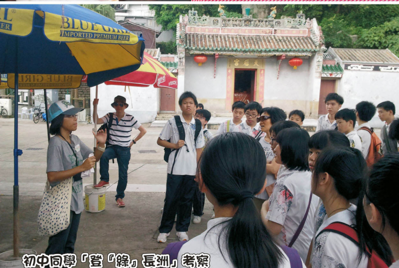
初中同學「登「線」長洲」考察