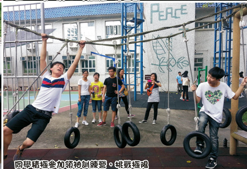
同學積極參加領袖訓練營，挑戰極限