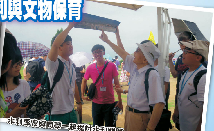
水利專家與同學一起探討水利問題