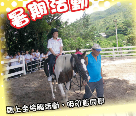
馬上全接觸活動，吸引着同學