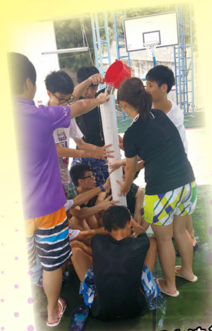
大家齊心合力把水注入水柱