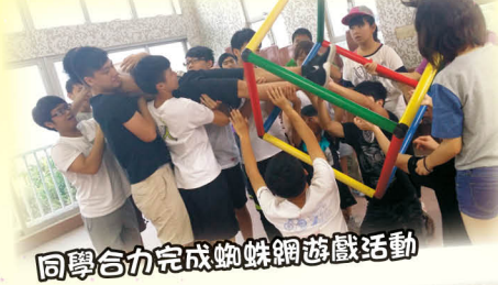
同學合力完成蜘蛛網遊戲活動