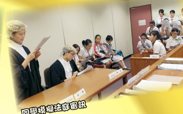
同學模擬法庭審訊