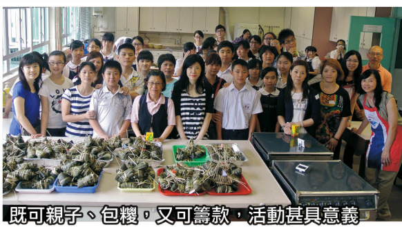
既可親子、包糉，又可籌款，活動甚具意義

由家長教師會與家政學會聯合舉辦的「2014萬糉同心為公益」已於5月17日星期六上午順利舉行，活動讓家長與同學一起包裹糉子，並將部份糉子出售，籌得善款撥歸公益金，同時亦會將部份糉子送給安老院長者以表關懷。當天，有多位家長及學生出席活動。