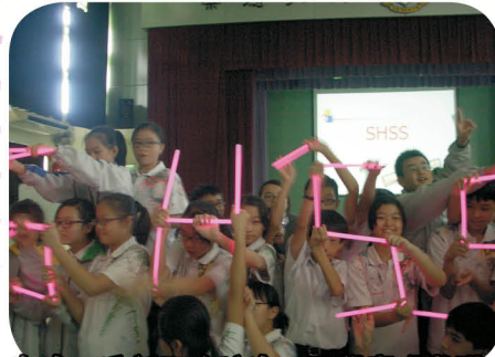
在中一迎新工作坊中，同學表現雀躍