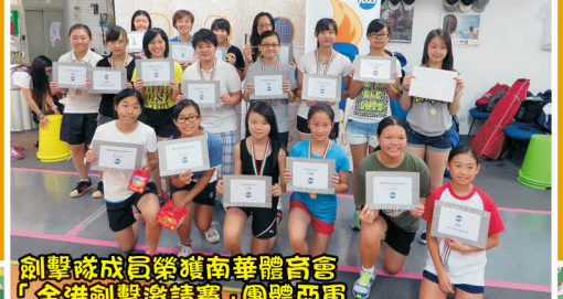
劍擊隊成員榮獲南華體育會「全港劍擊邀請賽」團體亞軍