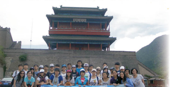
參與師生在長城關口前拍拍照，大家都成了好漢呢！