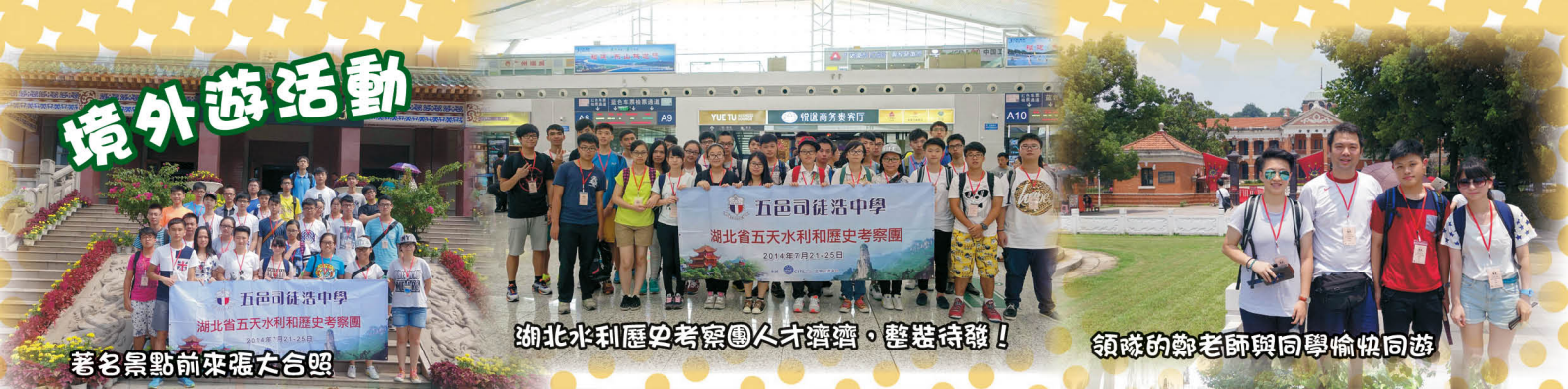
著名景點前來張大合照