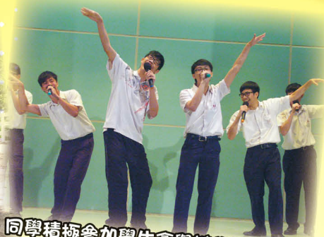
同學積極參加學生會舉辦的歌唱比賽