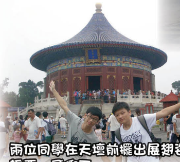
兩位同學在天壇前擺出展翅姿勢，誓要一飛衝天

這次北京義工之旅，同學為老人家們送歌獻舞，可說是盡了全力，雖然與一些老人家在溝通和表達上會出現阻礙，但最後看見他們流露如陽光般燦爛的笑容，這便是最好的回報，也是我們最想看見的結果。八天的義工之旅可說是辛苦，但就覺得光多麼猛烈，過程多麼辛苦，但都未令我卻步，反而化成點點熱血，令我更有動力去為老人服務。