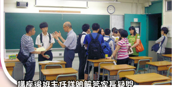
講座後班主任詳細解答家長疑問

當晚全體中三級同學出席，有98名中三級家長報名參加，共有91名家長出席，出席率為93%。收集問卷後，有95%的家長認為舉辦的日期及時間恰當；而佔90%家長認為是次活動對新高中的認識有幫助；約有90%的家長更認為簡介會有助家長協助學生選科取向。