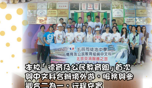
本校「德育及公民教育組」首次與中文科合辦境外遊，服務與參觀合二為一，行程充實