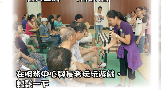
在服務中心與長者玩玩遊戲，輕鬆一下