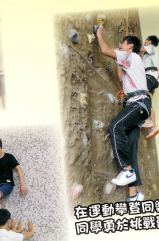
在運動攀登同樂日活動中，同學勇於挑戰難度