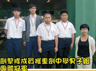
劍擊隊成員獲重劍中學男子組團體冠軍