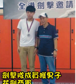
劍擊隊成員獲男子花劍亞軍