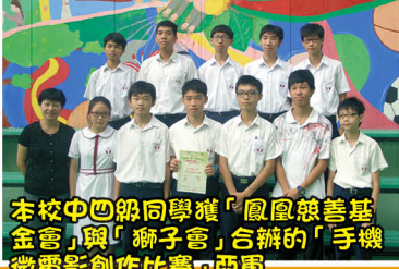
本校中四級同學獲「鳳凰慈善基金會」與「獅子會」合辦的「手機微電影創作比賽」亞軍