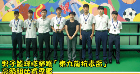
男子籃球隊榮獲「東九龍抗毒盃」高級組比賽季軍