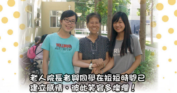
老人院長與同學在短短時間已建立感情，彼此笑容多燦爛！