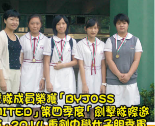
劍擊隊成員榮獲「GVJOSS LIMITED」第四季度「劍擊隊際邀請賽」2014重劍中學女子組季軍