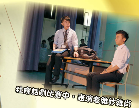
社際話劇比賽中，表演者維妙維肖