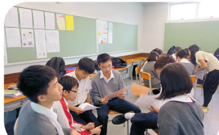
中四同學參加多元文化校園訓練工作坊，了解少數族裔人生的生活習慣