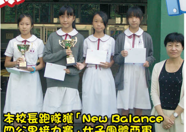
本校長跑隊獲「New Balance 四公里接力賽」，女子團體亞軍