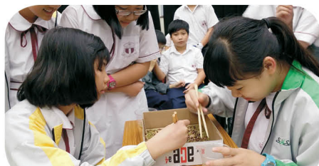
中一同學積極參與導航計劃迎新派對