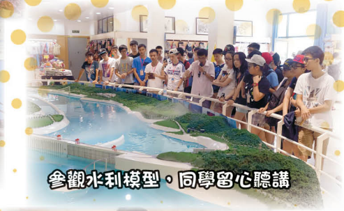
參觀水利模型，同學留心聽講