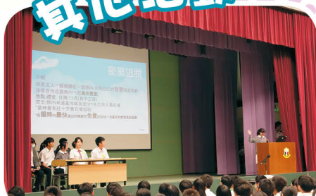
學生會候選內閣在諮詢大會上發表政綱