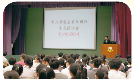
中六同學及家長出席畢業生多元出路家長會