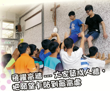
飛躍高牆——大家變成人牆，把願望卡貼到最高處